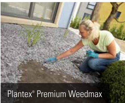
Plantex® Premium Weedmax