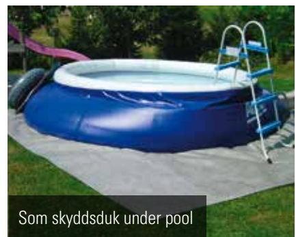
Som skyddsduk under pool

På grund av sin extrema draghållfasthet och goda filtreringskapacitet kan Plantex® Patio användas för många ändamål, bland annat de som visas ovan.