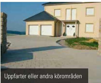
Uppfarter eller andra körområden

RULLSTORLEK 1 x 20 m, 2,10 x 10 m, 2,10 x 25 m